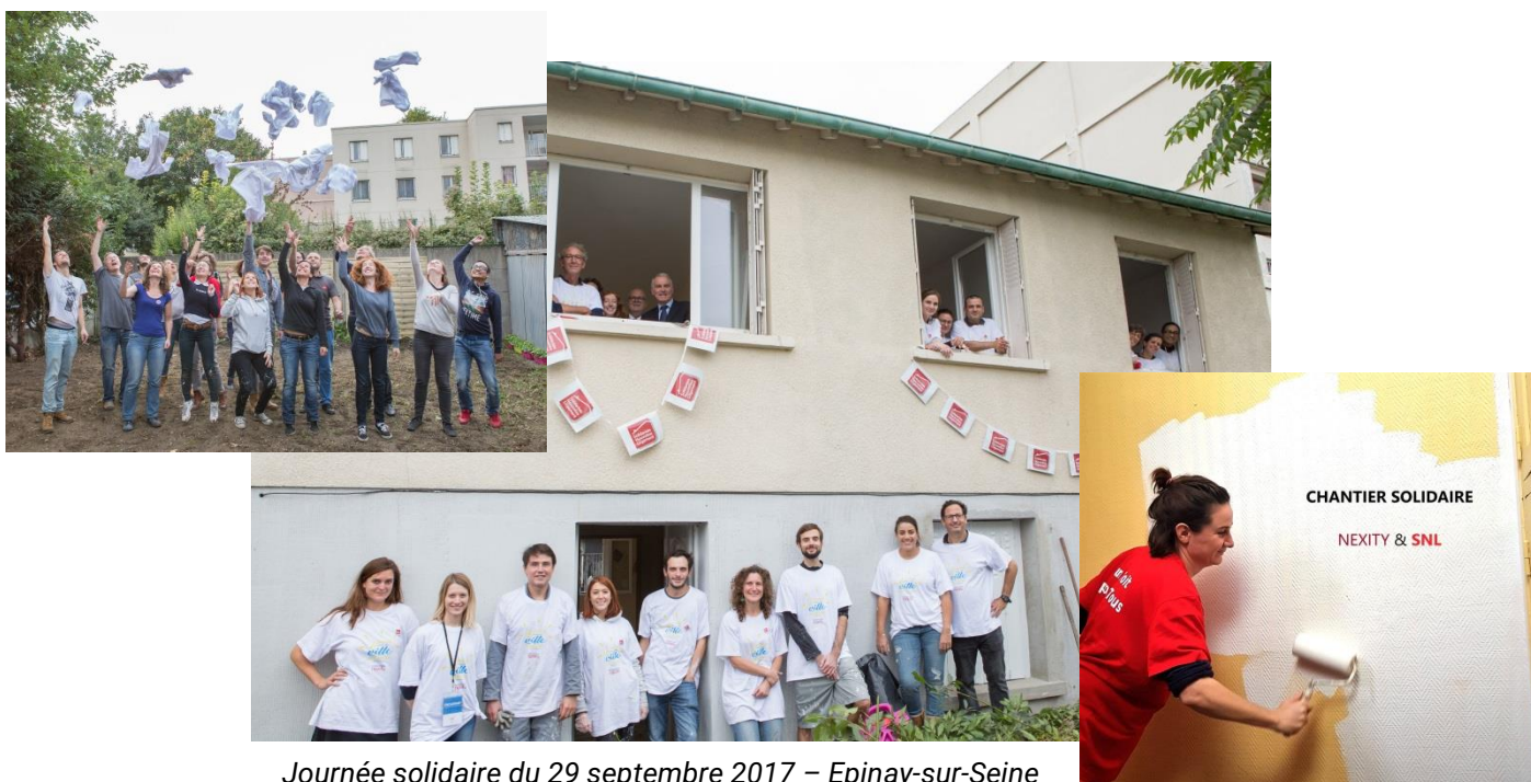
Journée solidaire du 29 septembre 2017 – Epinay-sur-Seine